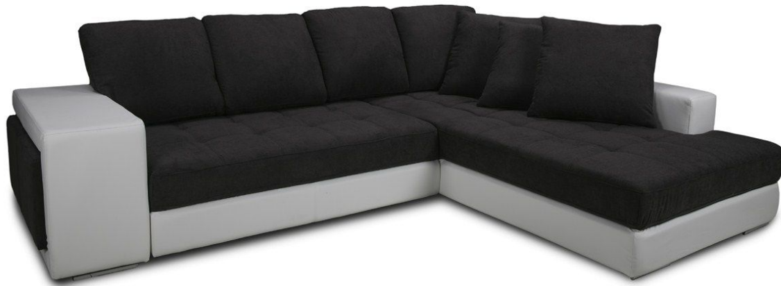
Princess II 2DL-OTM F180-D200