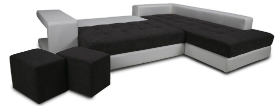
Princess II 2DL-OTM F180-D200 funktion